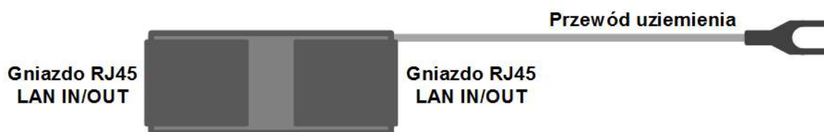
Rys. 1. Widok urządzeń IPP-1-2x-HS

Moduły serii IPP ograniczają przepięcia w sieci ETHERNET przejmując chwilowy impuls uderu elektrycznego. Moduły współpracują ze wszystkimi standardami zasilania PoE oraz z sieciami Gigabit Ethernet. Urządzenia działają bez podłączonego uziemienia ograniczając przepięcia powstałe między żyłami, dołączenie uziemienia pozwala na odprowadzenie ładunku do ziemi co zwiększa skuteczność ochrony. Układ obniża napięcie do bezpiecznego poziomu zmniejszając ilość awarii, nie wymaga zasilania i nie powoduje zakłóceń transmisji danych. Może być elementem zabezpieczającym urządzenia systemów CCTV IP, urządzeń sieci przewodowych ETHERNET, bezprzewodowych WiFi itp.